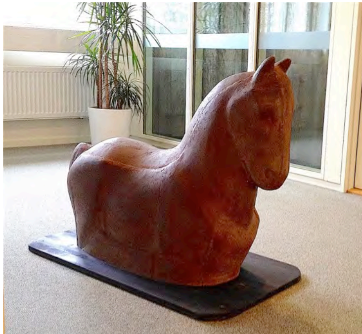
Häst på kommunkontoret

"Arbetet Hästvägsföreningen gör är jätteviktigt för att hästarna ska prioriteras när samhället växer!"